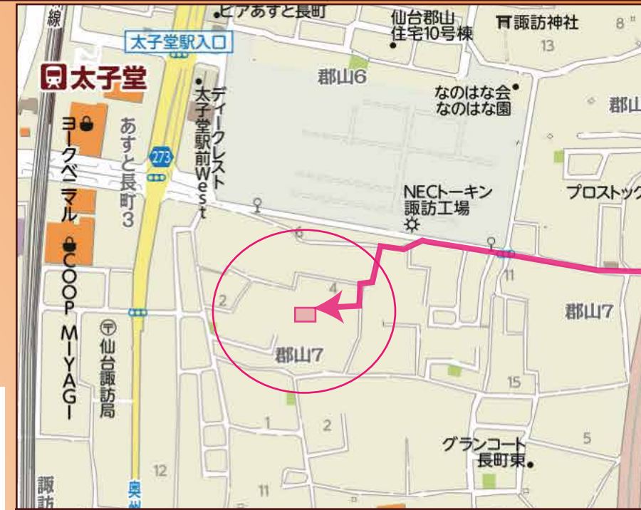
◎カーナビ設定は、仙台市太白区郡山7丁目18-1付近です

2号棟 3,280万円 (税込) 4SLDK 土地面積: 133.92㎡ 建物面積: 104.48㎡ 建築確認番号: 第H29SHC107072号