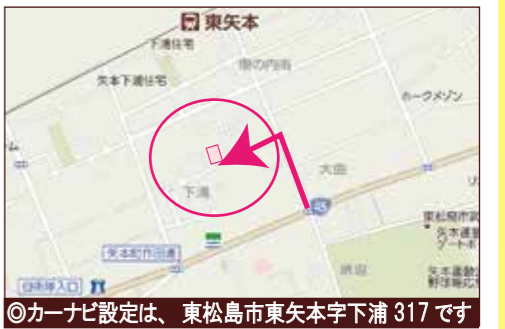
◎カーナビ設定は、東松島市東矢本字下浦 317 です