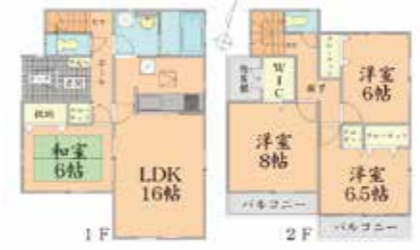
土地面積：150.70㎡ 建物面積：104.33㎡