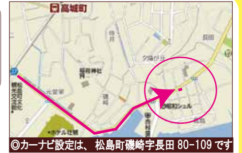
◎カーナビ設定は、松島町磯崎字長田 80-109 です

■お支払例■ 頭金なし・ボーナス払なし 月々 51,000 円 東邦銀行・借入1,930万円・変動金利・期間35年 0.6%のシミュレーションでございます。 金融情勢により、金利等の変更がある場合がございます。