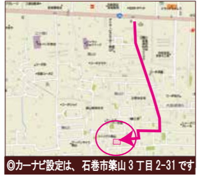
◎カーナビ設定は、石巻市築山3丁目 2-31 です