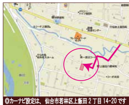
◎カーナビ設定は、仙台市若林区上飯田2丁目14-20です

バス停 徒歩4分 南面バルコニー 全居室6帖以上 駐車2台可能 経済的な都市ガス