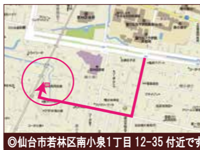
◎仙台市若林区南小泉1丁目12-35付近です