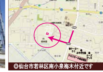
◎仙台市若林区南小泉梅木付近です