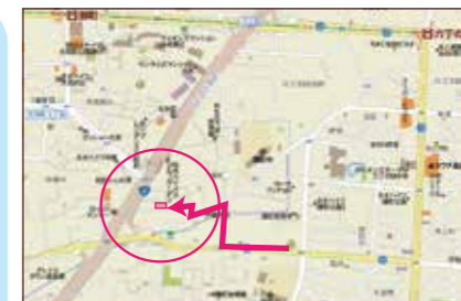
◎仙台市若林区蒲町19-41です