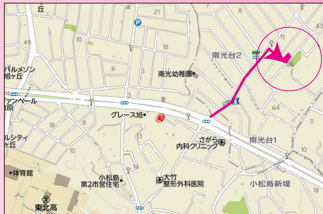
◎カーナビ設定は、仙台市泉区南光台1丁目10-2です