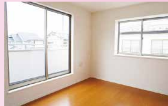
1号棟 洋室同仕様例