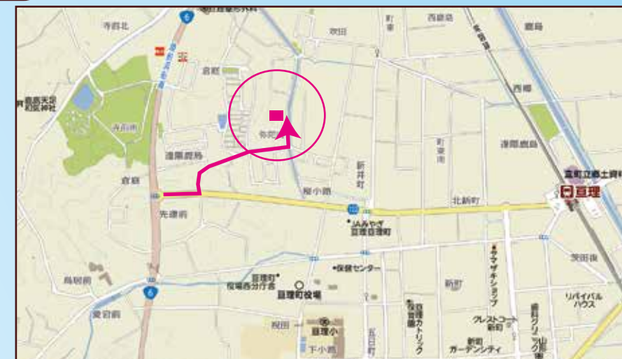
◎カーナビ設定は、亶理町逢隈鹿島字弥蛇内 56-7 付近です