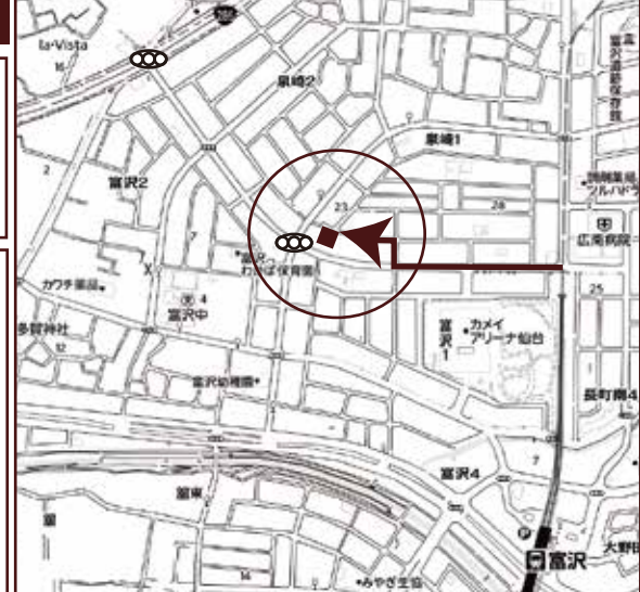
◎カーナビ設定は、仙台市太白区泉崎1丁目32付近です

■頭金なし・ボーナス15万円払 お支払例 月々 103,900円 東邦銀行・借入4,880万円・変動金利・期間35年0.6%のシミュレーションです。 金融情勢により、金利等の変更がある場合がございます。