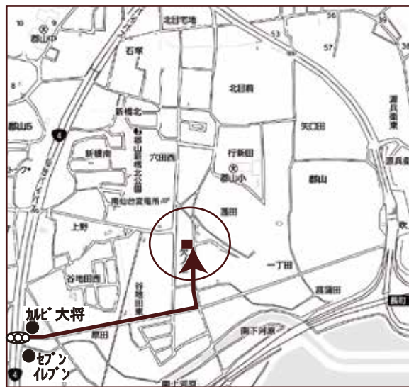
◎カーナビ設定は、仙台市太白区郡山字穴田東 23-6 付近です

■頭金なし・ボーナス払なし お支払例 月々 68,600円 東邦銀行・借入2,598万円・変動金利・期間35年0.6%のシミュレーションです。 金融情勢により、金利等の変更がある場合がございます。