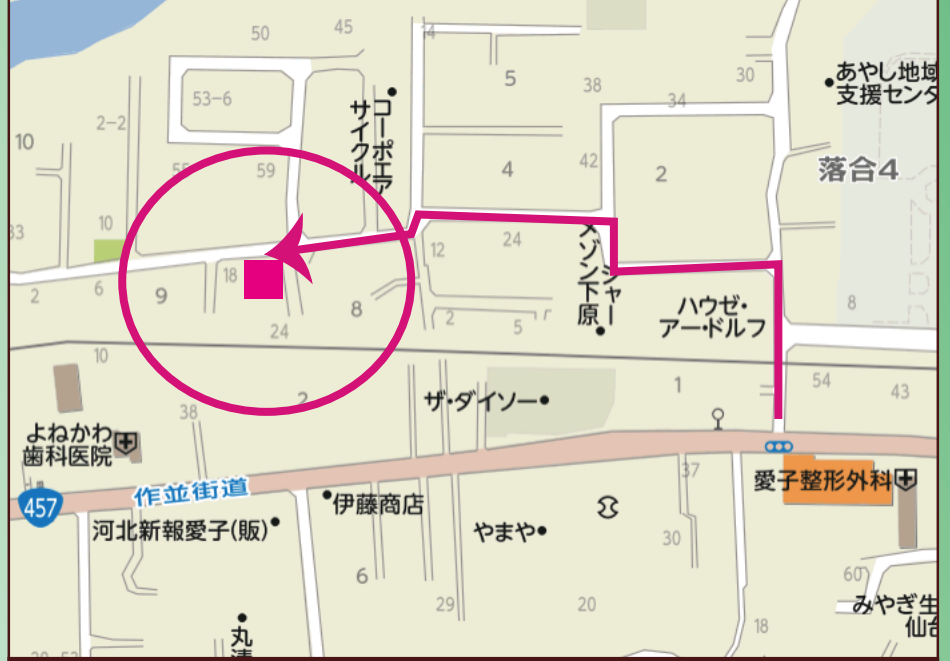
◎カーナビ設定は、仙台市青葉区愛子東 3 丁目 9-22 付近です