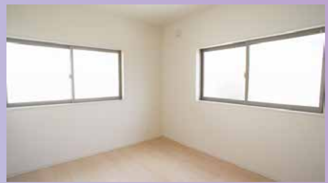
同ハウスメーカー仕様例