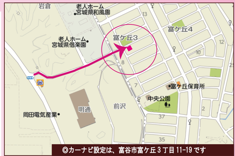
◎カーナビ設定は、富谷市富ヶ丘3丁目11-19です