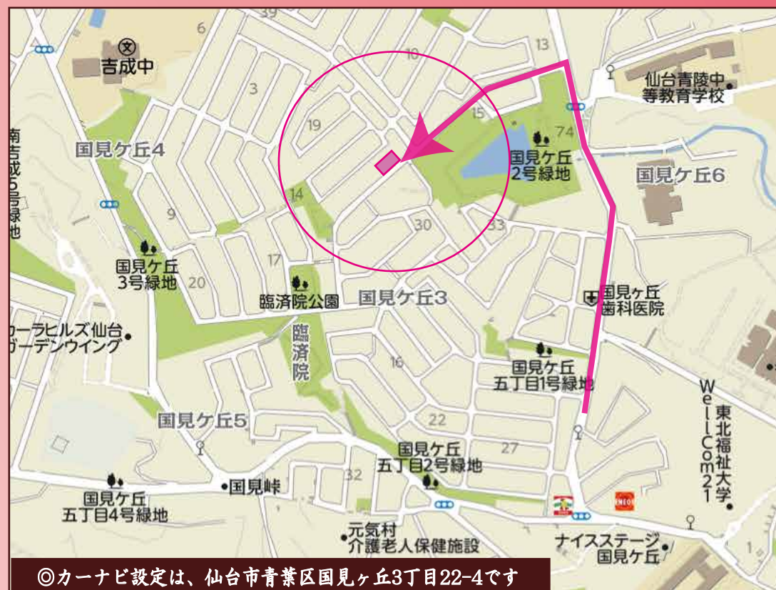
◎カーナビ設定は、仙台市青葉区国見ヶ丘3丁目22-4です