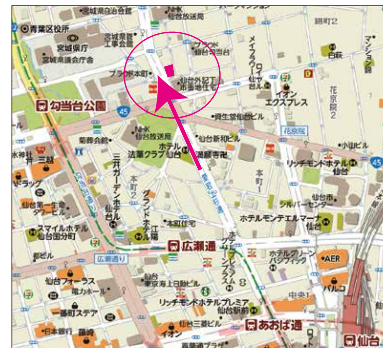
◎カーナビ設定は、仙台市青葉区錦町1丁目4-5です